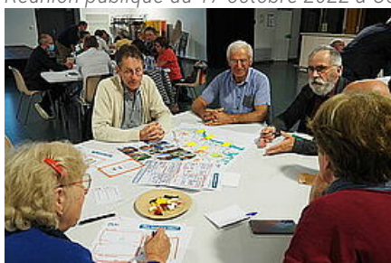
Réunion publique du 19 octobre 2022 à Campbon