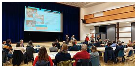
Saint Etienne de Montluc le 28 novembre