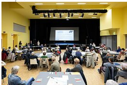
Réunion publique du 17 octobre 2022 à Savenay