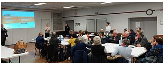
Prinquiau le 16 novembre