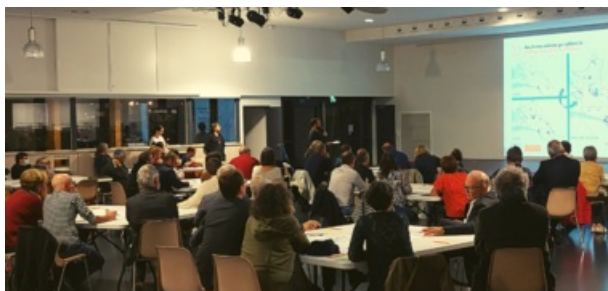
Réunion publique du 17 octobre 2022 à Cordemais