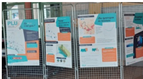
Différentes approches étaient proposées sous forme de panneaux d'exposition complétés par des quiz sur le territoire, un mur d'expression «quel territoire pour demain ?»