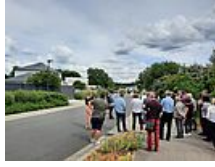
Visites des communes mai 2022