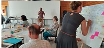
Ateliers des élus du 13 septembre 2022